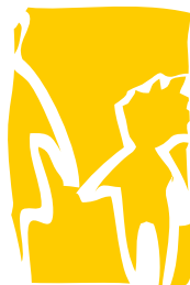
Minori e famiglie